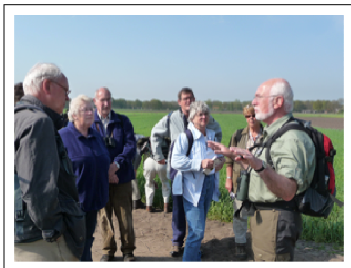
Beelden van de algemene excursie naar de Mosbeek