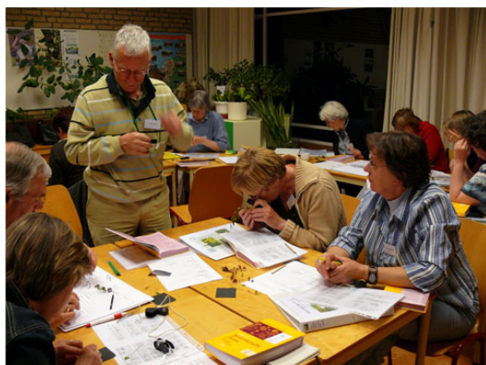
Een les in het natuurhuis