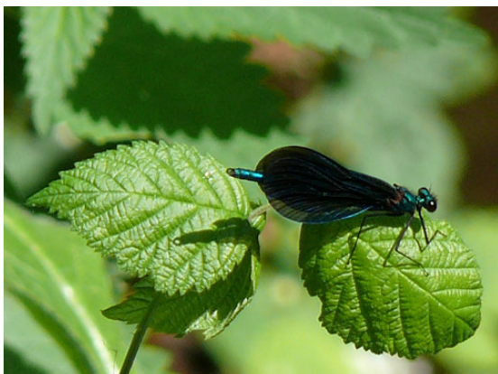
Mannetje bosbeekjuffer bij Bekendelle