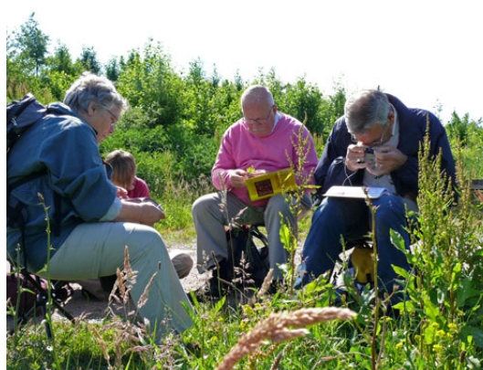
Excursie, 13 juni 2009