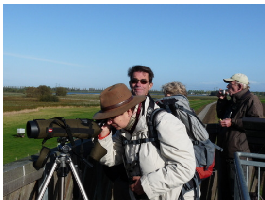
De vogelwerkgroep in actie