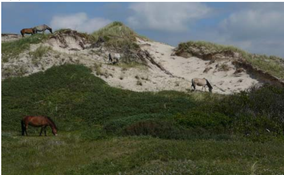
Foto: Toekomstbeeld Noordwest Natuurkern: begrazing in dynamische zeereep

Het project "Noordwest Natuurkern" is een echt Nationaal Park Zuid-Kennemerland project; er zijn veel van NPZK-partners bij betrokken. De gewenste verstuivingslocaties en enkele opties voor aanpassing van de recreatieve infrastructuur zijn in september 2007 aan de Adviescommissie en het Overlegorgaan van het NPZK voorgelegd en op een publieksavond in oktober 2007 toegelicht. Tussen nu en de daadwerkelijke realisatie (eind 2009/2010?) ligt nog een flinke periode. Een periode die gebruikt kan worden om draagvlak te krijgen voor "een levend duinlandschap voor natuur en mens."