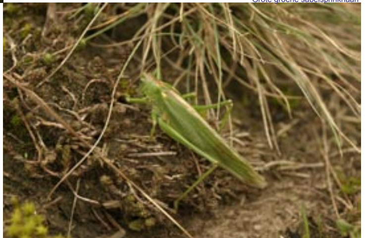
Grote groene sabelsprinkhaan