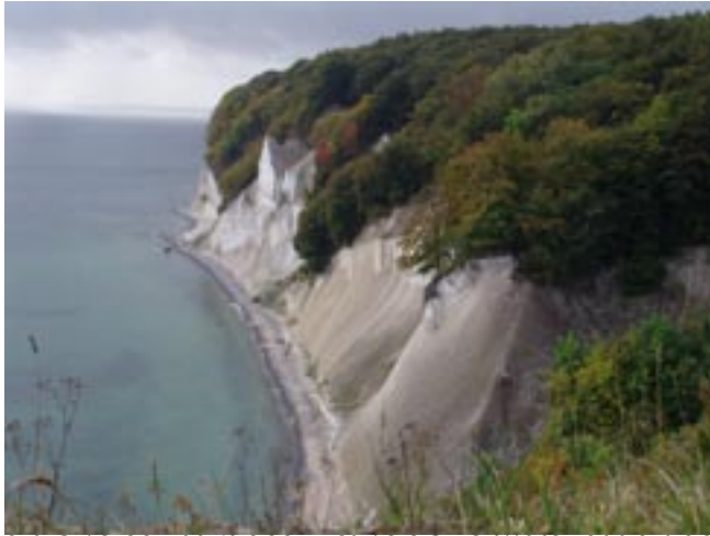
Krijtrotsen aan de kust van Jasmund

smeltende gletsjers wegstroomde. Geologisch noemt men dit fenomeen een "sandur". Dit vlakke land is vruchtbaar.