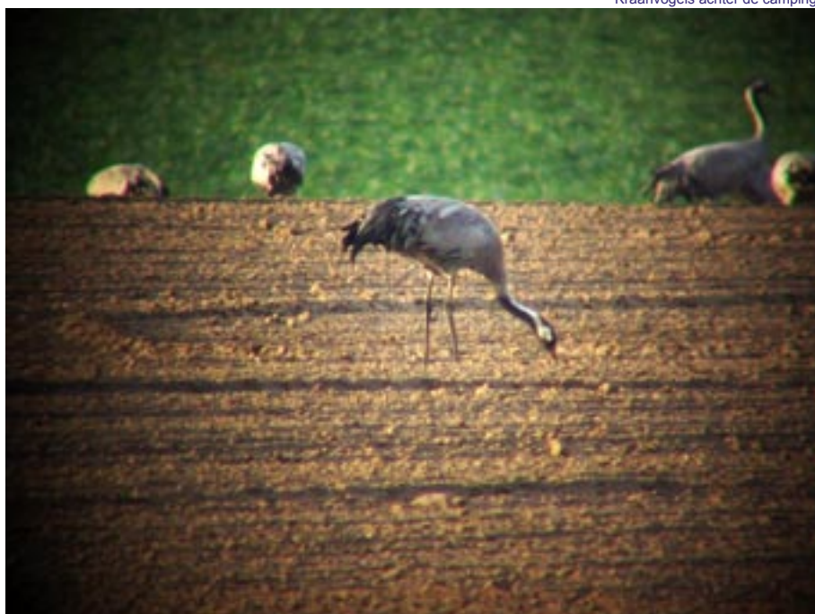
Kraanvogels achter de camping