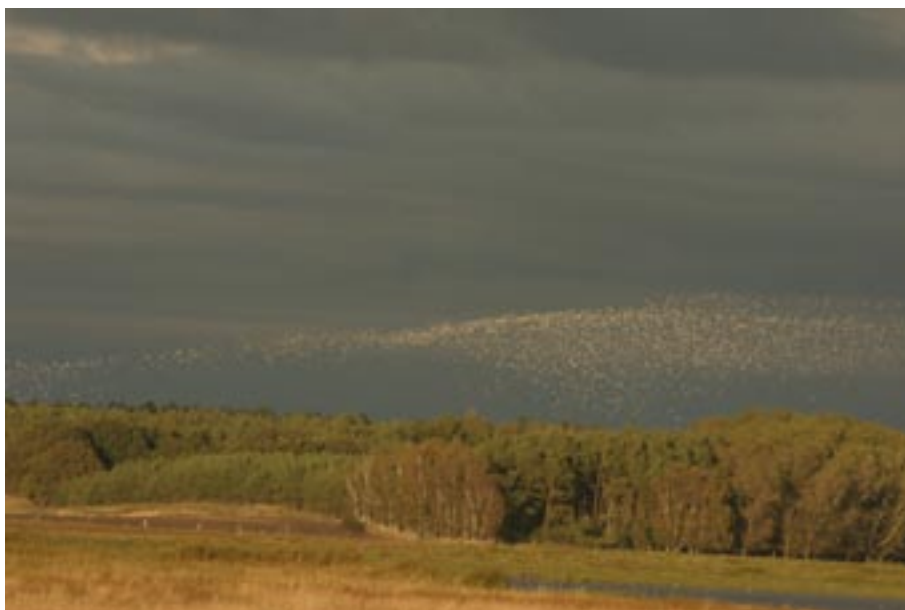
"Wolk" van Goudplevieren bij Umanz