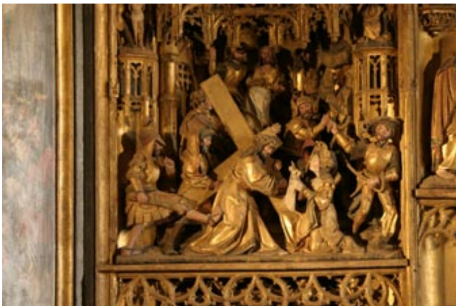
Detail van het "Antwerpener Schintzaltar" (plm. 1520) in de St. Mariën-kerche in Waase (Umanz)