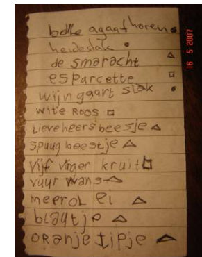
Foto: een rijke bladzijde uit het notitieboekje van één van onze jongste deelnemers

Harry van Haarlem (voorzitter kamp Schweighouse)