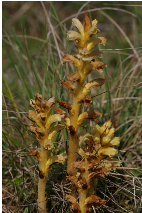
Rode bremraap ( Orobanche lutea )