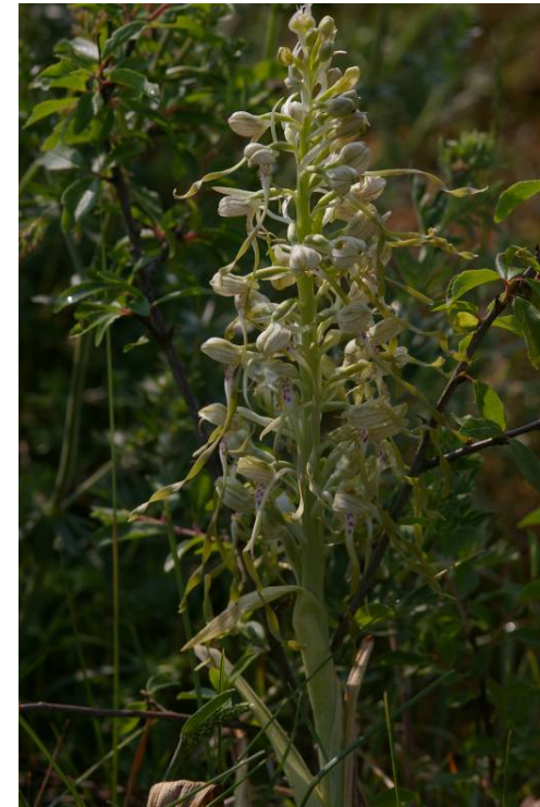
Bokkenorchis ( Himantoglossum hercynicum )