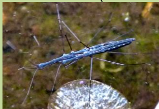
parende Gewone vijverlopers (Hydrometra stagnorum)

Voor kinderen (en hun ouder) (2,- euro p.p.) Start: Diemen Opgeven verplicht Natuurexcursie wg Spoorzicht