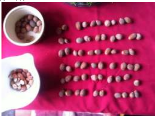
Hazelnoten pellen (foto Theo Peeters)

Hij besloot de hazelnoten te tellen, met het volgende resultaat: 52 volle noten; 20 lege noten; één kleine noot; één misvormde noot en één beschimmelde noot. Van de 75 noten dus 20 lege hazelnoten, dat is 26% van het totaal. Zijn vraag luidt: hoe kan dit? Is dit normaal bij hazelnoten? Was dit toeval? Was 2014 een slecht hazelnotenjaar? Is de standplaats van de hazelnoot bij Van Kooten slecht? Of is er een andere verklaring?