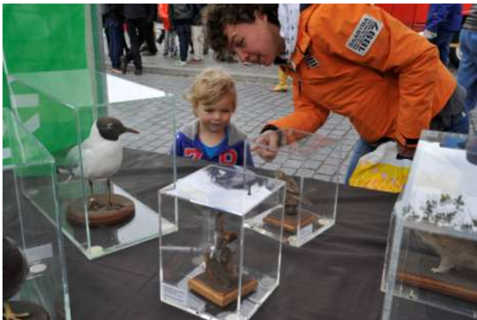
Aandacht voor de natuur in de Piushaven is er ook tijdens de Natuurmarkt op 31 mei