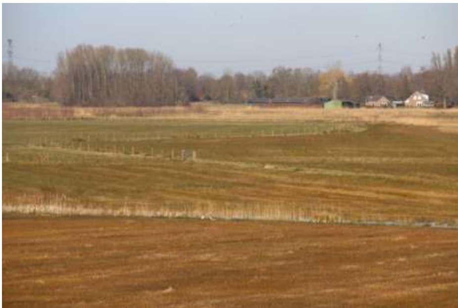
Agrarisch natuurbeheer in Den Opslag