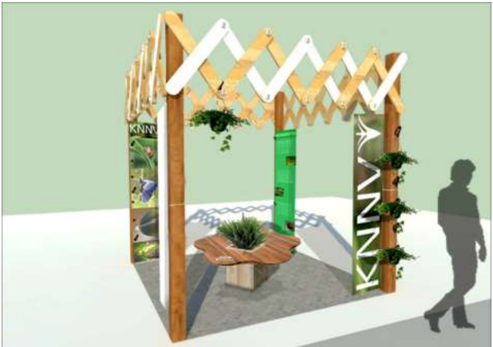
Een van de standontwerpen (Sint Lucas)