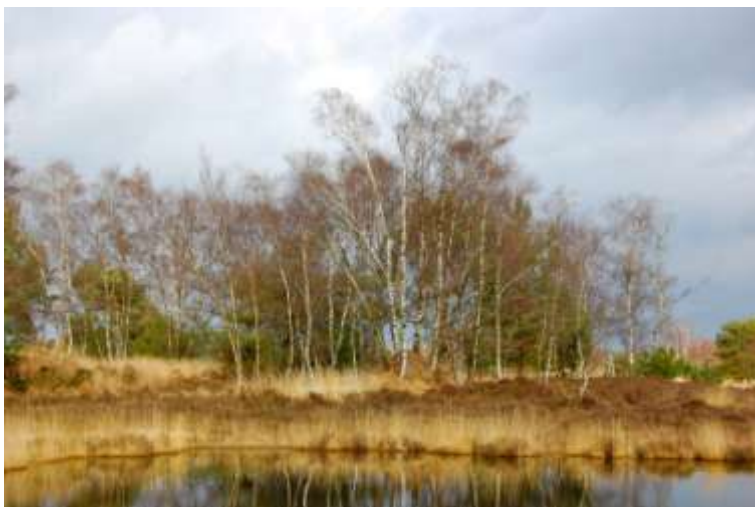
Mooie stukje Brabant