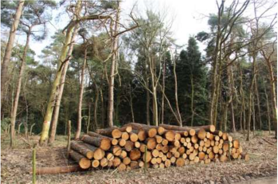
Door verkoop hout heeft terreinbeheerder wat meer financiële middelen.