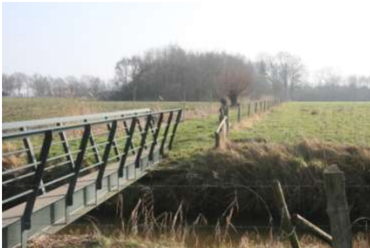
Het Gooren