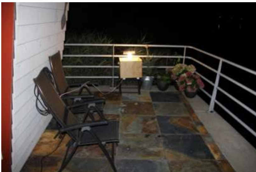
Skinner-val bij mijn woning

Deze locaties zijn verdeeld over 3 km-hokken en hebben volgens de Noctua-database voor ca. 90% van de gevonden soorten nieuwe waarnemingen opgeleverd voor de betreffende km-hokken. Het is leuk te weten dat mijn inventarisaties derhalve een mooie bijdrage aan de landelijke verspreidingskaartjes leveren. Vermeldenswaard zijn de waarnemingen van Oranje O-vlinder, Bochtige smele- en Streepstipspanner, die alle drie (vrij) zeldzaam voor onze regio zijn. Ook Satijnstipspanner, Duinhalmuiltje, Weidehalmuiltje, Spitsvleugelgrasuil, Egelskopboorder en Variabele W-uil kennen een verspreidingsbeeld dat meer het lage deel van Nederland bestrijkt.