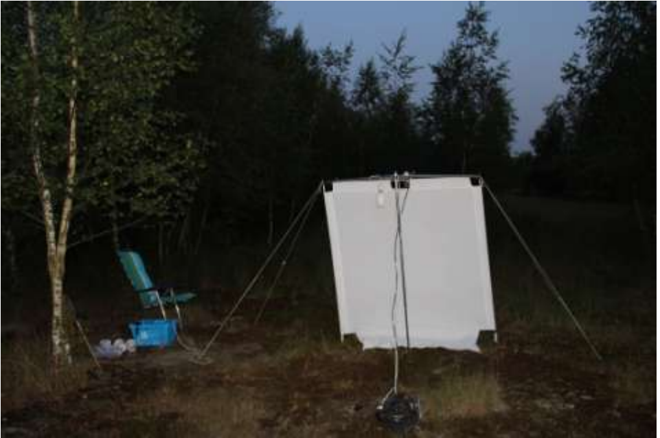
Opstelling licht-op-laken in het vrije veld