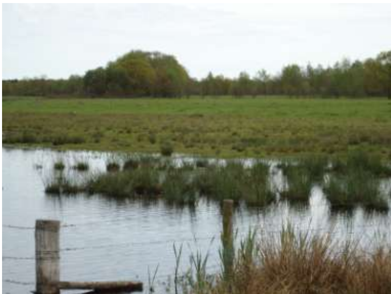
Plas dras en vochtige weilanden