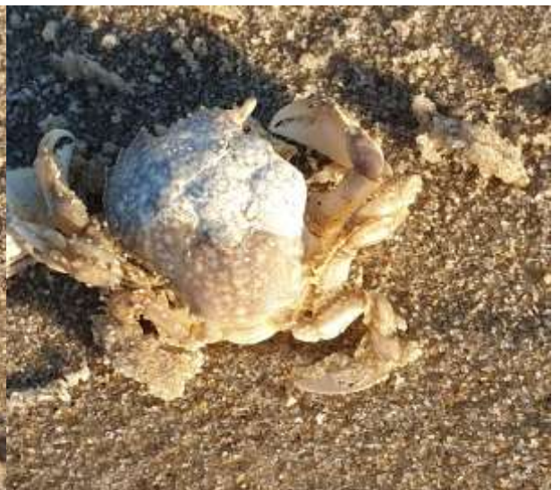
Breedpootkrab, mislukte vervelling