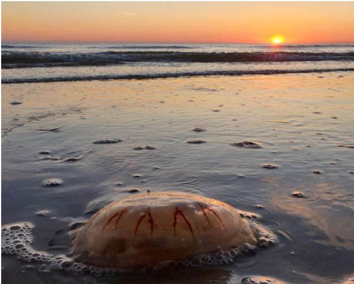
Kompaskwal bij Hargen aan zee