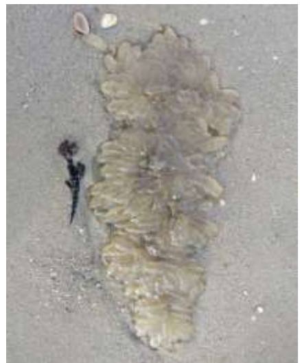
Eieren dwergpijlinktvis Ruud Costers

Op 20 juni was zoals vermeld een vismonitoring door Stichting Anemoon bij Egmond. Het kornet werd getrokken door Dennis Leeuw.