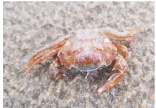
Gewimperde zwemkrab Bakkum

Het ontbreken van tanden aan het schild tussen de ogen duidt op gewimperde zwemkrab.