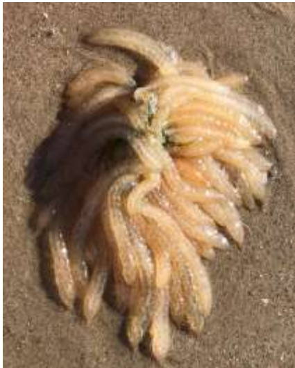
Eieren gewone pijlinktvis Lucette Robertson

Op 20 juni nam ik deel aan het vismonitoringprogramma van Stichting Anemoon bij Egmond - Zuid. In het kornet zaten naast veel visjes en garnalen ook weer eieren van de gewone pijlinktvis en ook een heleboel juveniele inktvisjes.