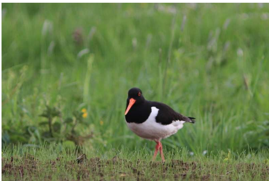
Scholekster