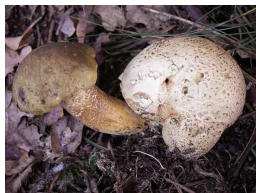
Kostgangerboleet ( Boletus parasiticus )