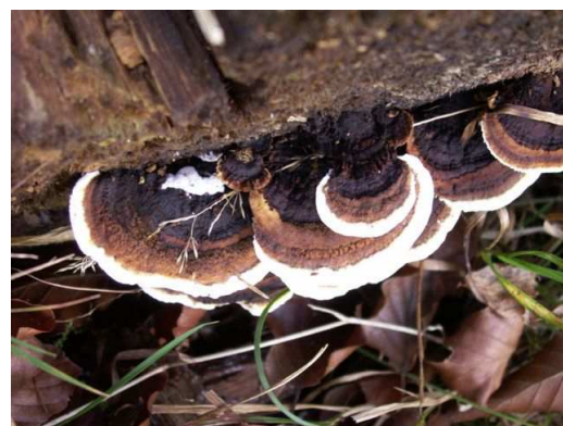
Geelbruine plaatjeshoutzwam ( Gloeophyllum sepiarium )