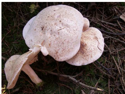
Roestvlekkenzwam ( Collybia maculata )

In het bos was aanvankelijk niet veel te zien, maar omdat we met onze neus op de bosbodem liepen, zagen we toch heel veel soorten. We zagen de Kostgangersboleet (zie foto), veel melkzwammen, trechterzwammen, mycena's, fopzwammen en franjehoeden, teveel om op te noemen. Een aantal paddenstoelen was al van verre te zien, zoals de