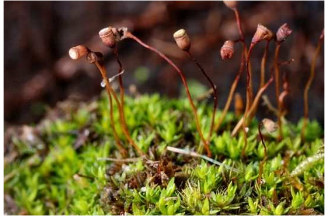
Kleine viltmuts (Pogonatum nanum).