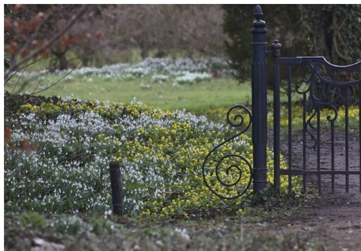
Wildenborch in maart

verspreiden. Veel van die geofieten, planten met een bol, knol of wortelstok, worden tot de Stinzenflora gerekend. Over Stinzenflora wil ik na de vergadering graag iets vertellen en vooral laten zien via foto's. Veel van onze leden kennen plaatsen waar Stinzenplanten groeien en in voorgaande jaren zijn we wel eens op excursie geweest naar de Vechtstreek, waar veel buitenhuizen met fraaie tuinen zijn gelegen. Ook Den Wildenborch bij Vorden hebben we meerdere malen bezocht. Dit jaar hopen we op 1 april op de Colckhof Stinzenplanten tegen te komen. Via deze presentatie kunnen we nog meer het voorjaarsgevoel naar boven halen door allerlei soorten die meestal niet op een plaats bijeen staan op foto's te laten verschijnen.