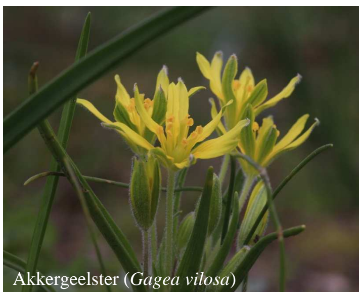
Akkergeelster ( Gagea vilosa )