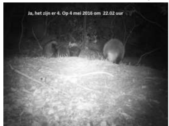
Figuur 3 Dassen, gefotografeerd met een cameraval

De middelste dassentunnel aan de zuidkant van de A1 was opnieuw ondergraven. Na een misverstand met Rijkswaterstaat-Oost over de plek kwam de samenwerking op gang en werd de reparatie snel uitgevoerd. Na het oogsten van de maïs bleek in een maïsperceel, vlak naast een houtwal een diepe dassenpijp te zijn gegraven. Na overleg met Das en Boom en de perceeleigenaar hebben we de pijp deels dichtgegooid. De pijp bleek niet bewoond en na toestemming van de perceeleigenaar hebben we de uitgeworpen grond in de pijp teruggegooid. Daarmee kwam een eind aan het gevaar voor de das, de landbouwmachines en de bestuurders. De waarnemingen met de nachtcamera's leverden behalve informatie over dassen, ook beelden van vossen, steenmarters, hazen, eekhoorn, reeën en zelfs een BOOMMARTER op. Het gebruik van cameravallen groeit. We gaan volgend jaar ook kistjes met camera's plaatsen. Speciaal voor het inventariseren van de kleine marterachtigen. We hopen dat we u ook volgend jaar weer leuke waarnemingen kunnen laten zien.