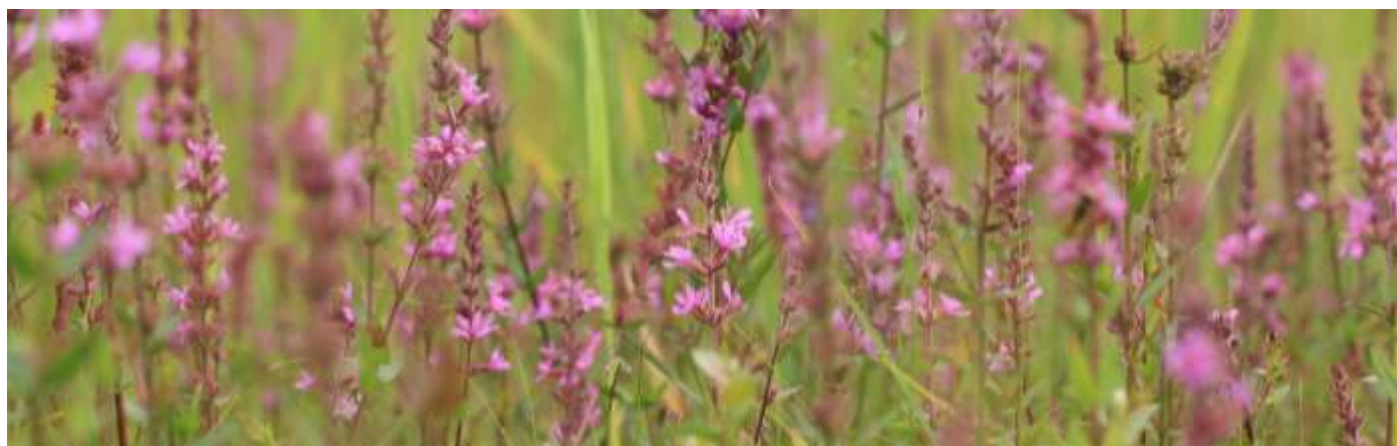
Figuur 5 Grote kattenstaart ( Lythrum salicaria ) in Baarlermars, 2016