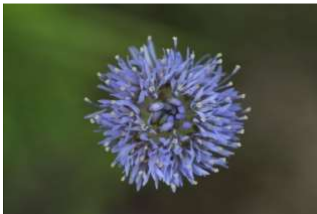
Figuur 9 Zandblauwtje ( Jasione montana )

In de km-hokken waar naar het voorkomen van bepaalde soorten is gezocht (Distelbremraap en Kruipend moerasscherm) zijn deze soorten niet aangetroffen. 2 de jaar Bannink/Gooiermars: monitoring leverde vooral voor de transecten in het zuidelijk deel van de Gooiermars verrassende soorten op. Interessant te noemen zijn Slofhak, Bosdroogbloem, Gevleugeld helmkruid, Stijve ogentroost, Duits viltkruid, Kamgras.