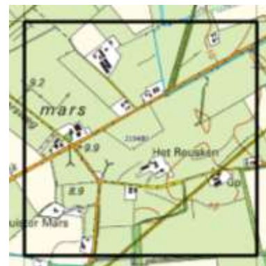
Het Reusken (219-480)

150 waarnemingen Brede orchis, Brede wespenorchis, Doorgroeid fonteinkruid, Kruipend zenegroen, Moerasspirea, Veldrus, Waterpunge, Welriekende salomonszegel