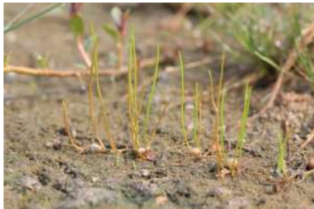
Figuur 4 Pillwax ( Pilularia globulifera ) bij Lettelereide in 2011.