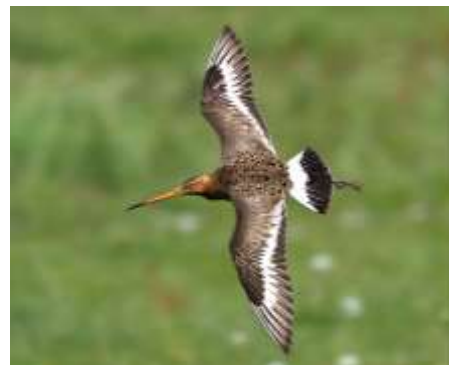
Figuur 1 Grutto