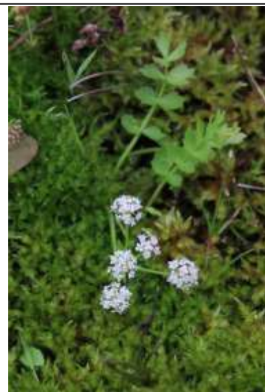
Figuur 7 Kruipend moerasscherm ( Apium repens ) in Baarlermars, 2016.