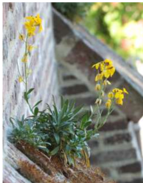
Figuur 6 Muurbloem ( Erysimum cheiri ) op muur van Bergkerk.