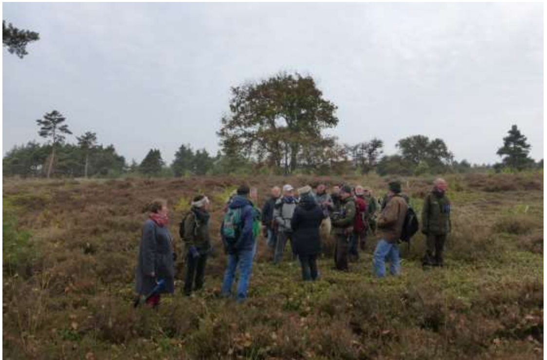
Figuur 2 Excursie Sallandse Heuvelrug

Door afschaffing van de markestructuur en de intrede van de stoommachine en kunstmest verdween die economische functie en werd een groot gedeelte omgezet in verkaveld landbouwgebied. Van de oorspronkelijke heide bleven eilandjes over die verbosten, deels door aanplant. De laatste decennia zien we verwerving door Natuurmonumenten, heidebeheer en toekenning tot