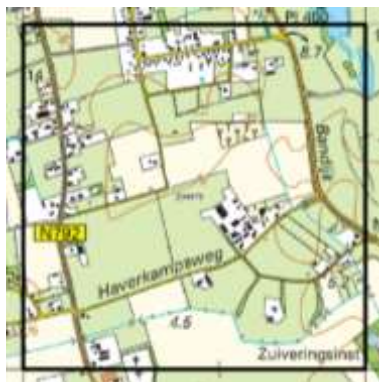
De Wijk (204-475)

132 waarnemingen Kleine bevernel, Oosterse morgenster, Rapunzelklokje