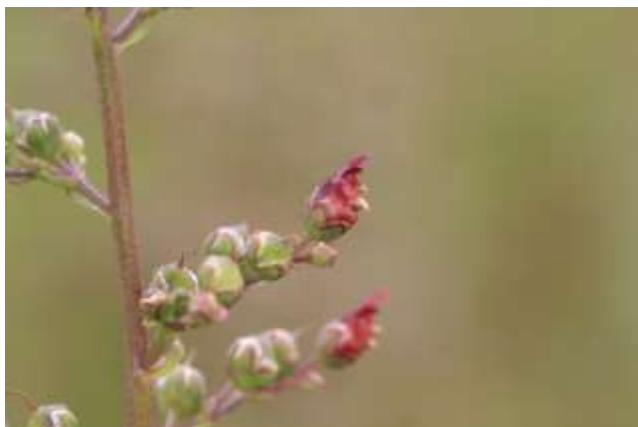
Figuur 8 Gevleugeld helmkruid ( Scrophularia umbrosa )

150 waarnemingen Brede orchis, Brede wespenorchis, Doorgroeid fonteinkruid, Kruipend zenegroen, Moerasspirea, Veldrus, Waterpunge, Welriekende salomonszegel