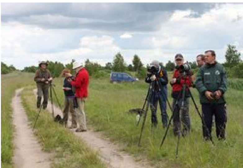
Observing Greater Spotted Eagle.

www.aquaticwarbler.net/mon/Belarus_2011.html