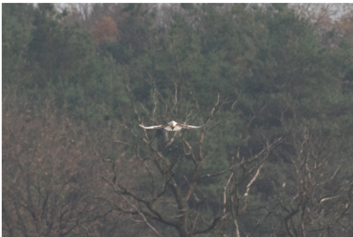
Grijze wouw foeragerend