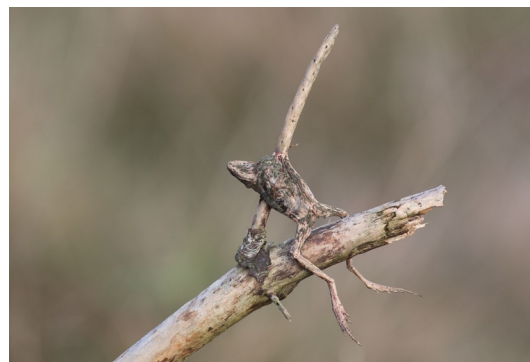
Opgespitste prooi van een Klapekster