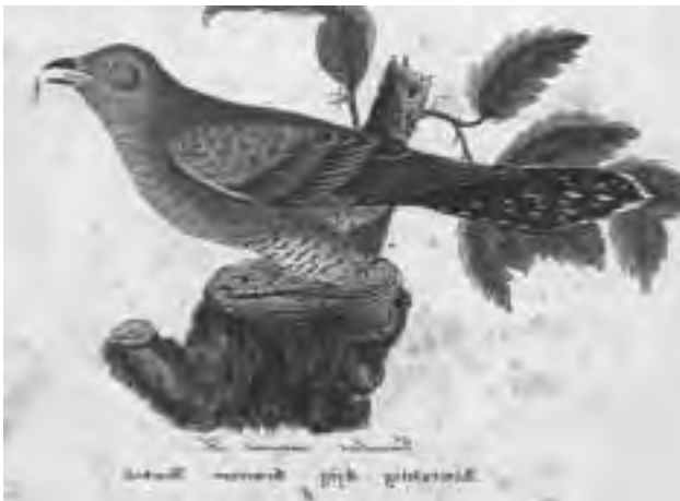
De afbeelding is getekend door de Deense tekenaar Niels Kjærboilling. Uit: Icones ornithologiæ Scandinaviæ . [1875-9]