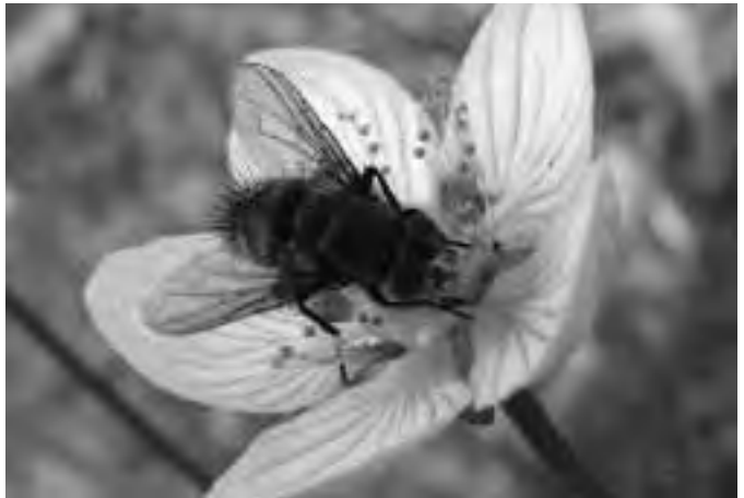
Vlieg op parnassia