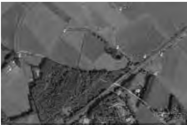
Plattegrond van de Helmhorst en de raaien

Zaterdagmorgen om acht uur, de volgende ronde! De rondes moeten om de 8 uur gelopen worden, anders zitten de muizen te lang in de vallen met het risico dat het voer opraakt en de muis overlijdt t.b.v. de wetenschap en dat is niet echt de bedoeling! We zijn vanmorgen met vijf mensen en verdelen ons weer in twee groepjes.