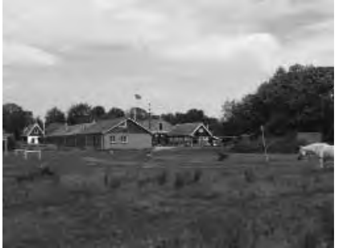
Kampeerboerderij De Binnenkampen

Het weekend zal gehouden worden van 28 t/m 30 mei 2010. De locatie zal zijn: Kampeerboerderij De Binnenkampen. De eerste twee keren zijn we daar ook geweest, dus is het geen onbekende plek. We huren de kleine groepsaccommodatie. Deze is geschikt voor maximaal 28 personen. Deze accommodatie bestaat uit recreatie-/eetzaal met keuken, 2 slaapzalen voor elk 4 personen en een grote slaapzaal voor 20 personen.