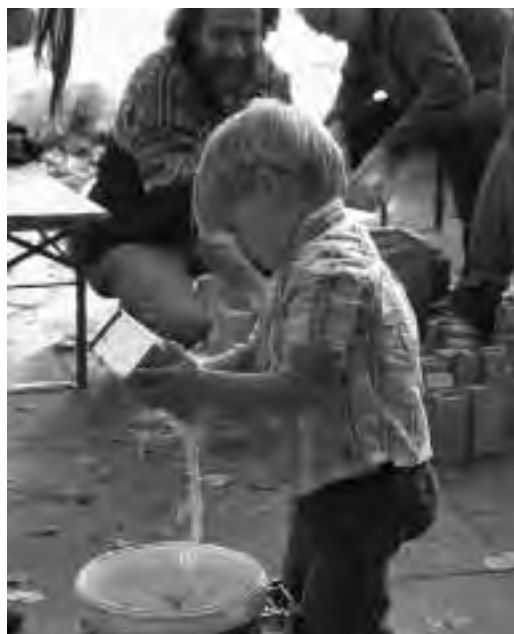
De kinderen vermaken zich prima en zelfs de jongste helpt een handje mee.

Het was een geslaagd weekend met een heleboel leuke en leerzame momenten.