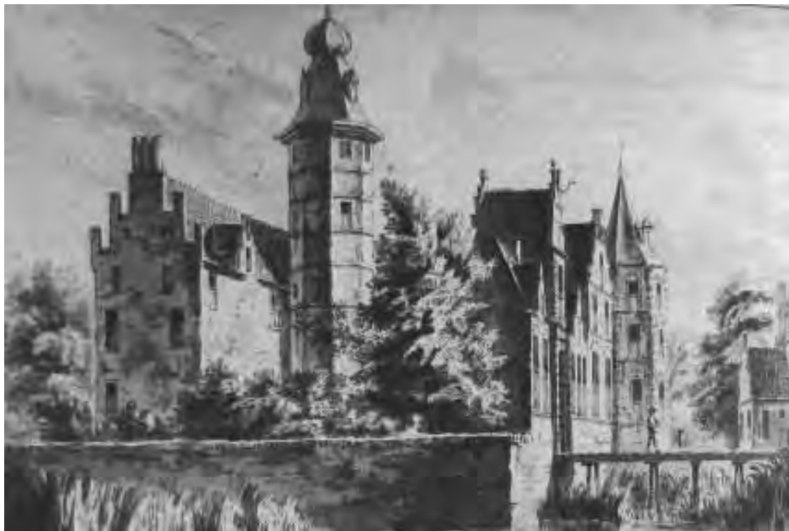
't Huis Westerveld by Zwolle, 1729', tekening door Abraham de Haen.