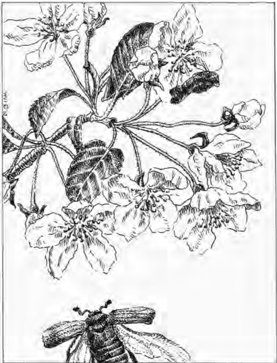
© illustratie: Willemien van Ittersum 2010