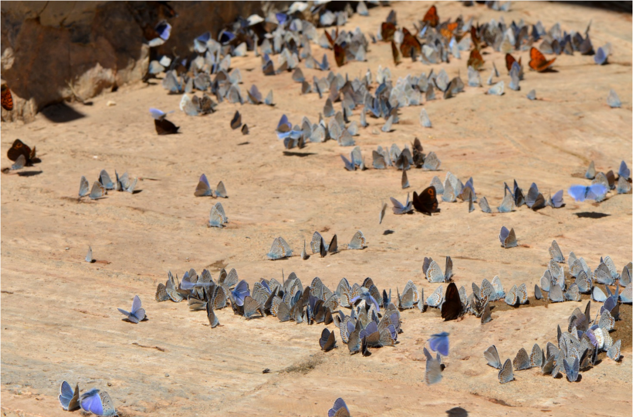
Drinkgezelschap van vooral blauwtjes in Galičica NP.

De nadruk van deze reis zal liggen op dagvlinders. Dat impliceert dat we op de goede vlinderplekken rustig de tijd nemen om de soorten in het veld te identificeren, en te fotograferen. Gezamenlijk zullen we ook achteraf in ons hotel nog (fotografisch vastgelegde) soorten op naam proberen te brengen. Natuurlijk kunnen we libellen en andere dieren niet negeren. Ook Balkanplanten zullen niet aan onze aandacht ontsnappen.