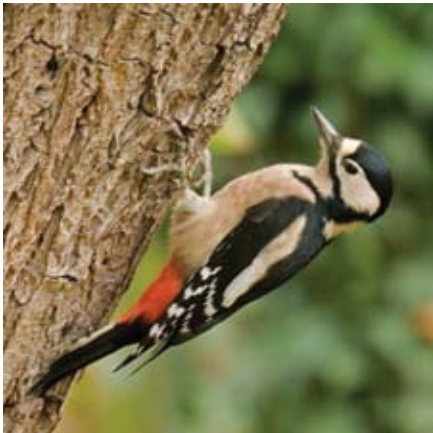
grote bonte specht

Stiekem is er de hele dag toch even naar vogels gekeken en is het lijstje van de ochtend verder aangevuld met o.a. kneutjes, putters, sprinkhaanzanger, groene - en grote bonte specht en havik. Totaal zijn er uiteindelijk 55 soorten waargenomen.