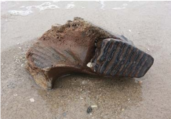
strandvondst, foto: Joanna Smolarz

Heeft u zelf ook fossielen gevonden op de Maasvlakte, neem deze dan mee! Misschien kan Walter u meer vertellen over de oorsprong.