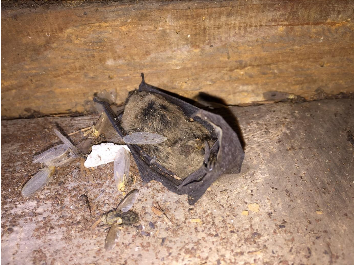
Dwergvleermuis dood, daaromheen veel afgekloven vleugels van gaasvliegen en vlinders wat wijst op grootoorvleermuizen