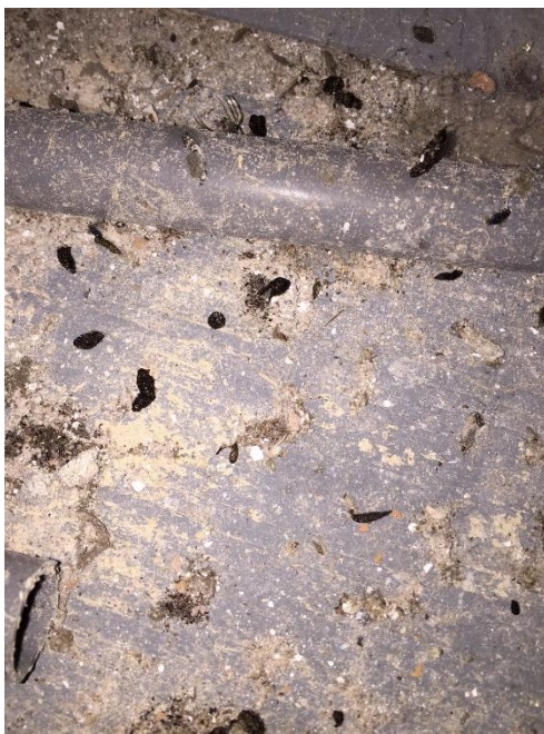
Uitwerpselen van twee soorten vleermuizen, Dirksland

Er waren ook verhalen van leegloop en opnieuw aanwas van kerkgangers, geruzie tijdens de oprichting van de PKN (een soort unie van kerkrichtingen), die andere richtingen weer deed afsplitsen, vanwege de te liberale richting etc, etc. We werden op de koffie gevraagd tijdens een koffieochtendje met kerkgangers. We zijn de tent uitgeblazen omdat er orgel werd gespeeld, terwijl we een inspectierondje deden op een kerkzolder. We zijn een paar maal houtworm tegen gekomen. Kortom het was een leuke, boeiende en inspectieronde.